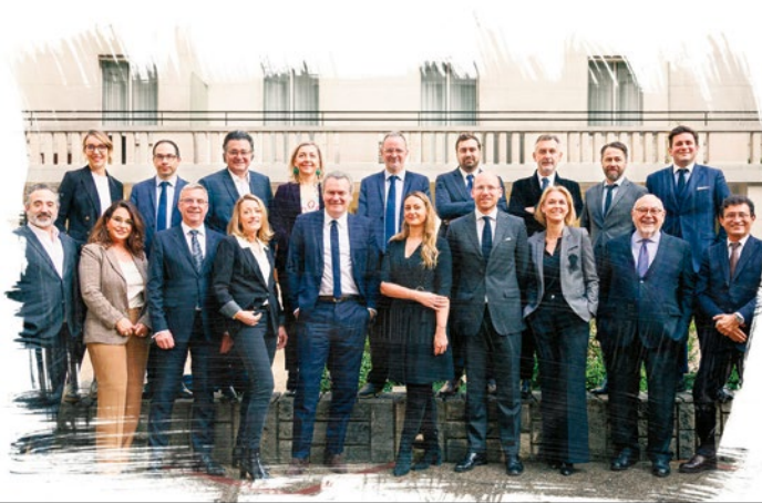
Simon Associés, une équipe réunie autour de valeurs communes*

J.-C. et F.-L. S. : Oui, car nous sommes depuis longtemps acteurs de la transformation numérique de la profession. Nous avons développé nous-mêmes des outils tels que Mission RGPD, pour la gestion des données nominatives, LCM (Legal Client Management) et SimonAcademy, offrant une doctrine toujours à jour. Notre prochain projet est une plateforme qui mettra en relation les avocats indépendants avec leurs clients, une solution originale, jamais rencontrée. Ce travail est aussi pour nous le moyen de garantir la relation fluide, transparente et efficace qui est l'empreinte que nous portons ■