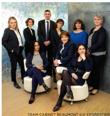
TEAM CABINET BEAUMONT